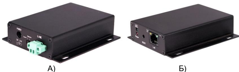
Рис. 1 Внешний вид TA-IP, RA-IP (А – вид спереди, Б – вид сзади)