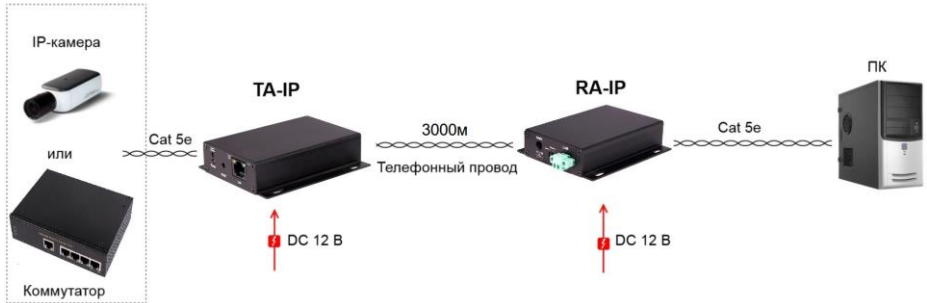
Рис. 3 Схема подключения TA-IP и RA-IP