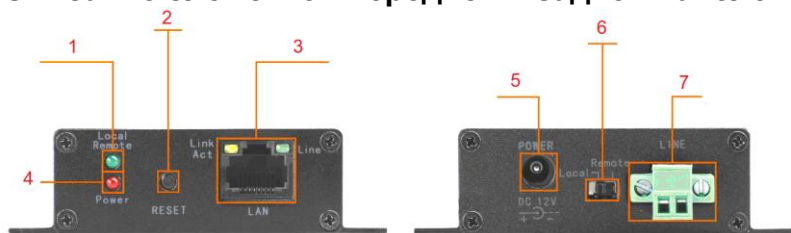
Рис. 2 Элементы устройств TA-IP и RA-IP