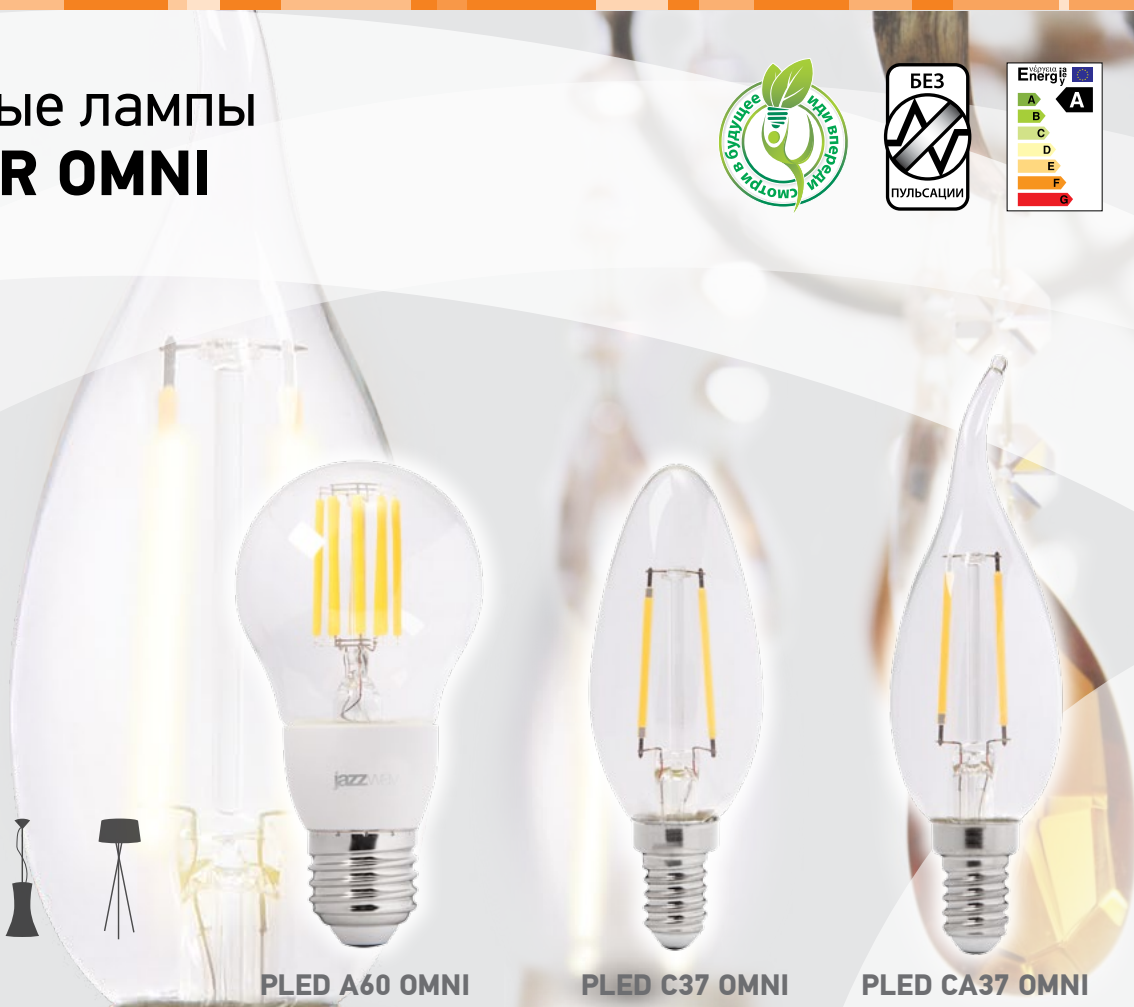
PLED A60 OMNI