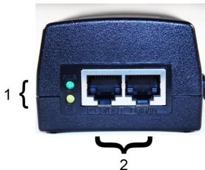
Рис.1 Midspan-1/300GA, Midspan-1/300G, Midspan-1/600G вид спереди Табл.1 Элементы передней панели инжектора