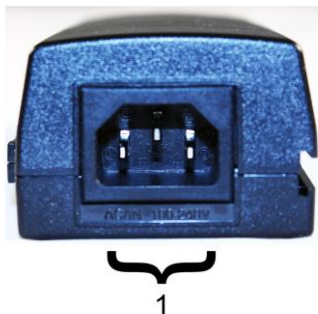
Рис.2 Инжектор Midspan-1/300GA, Midspan-1/300G, Midspan-1/600G вид сзади