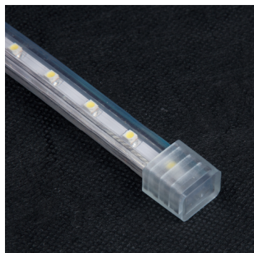
Торцевая заглушка для изоляции конца ленты MVS