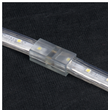
Коннектор для соединения отдельных участков ленты MVS