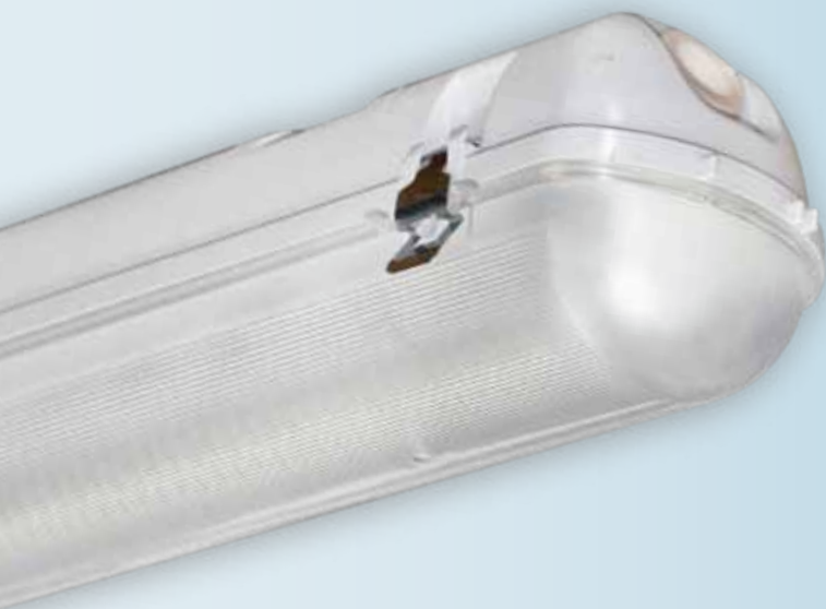
Соединение светильников в линию