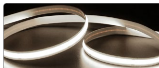
арт. 48264 4000K