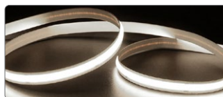
арт. 48271 4000K