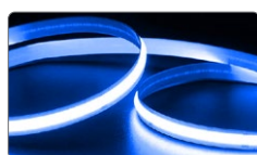
арт. 48267 синий