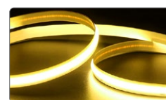
арт. 48269 жёлтый