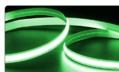
арт. 48268 зеленый