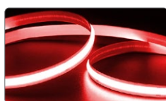
арт. 48266 красный