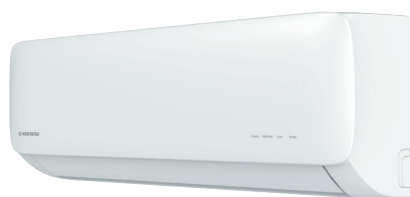
Внутренний блок KSGA53HFAN1