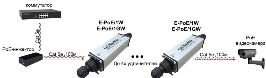
Рис. 7 Схема подключения удлинителей на примере модели E-PoE/1W, E-PoE/1GW