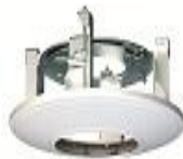
DS-1227ZJ Внутрипотолочное крепление