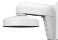
DS-1273ZJ-135 Настенный кронштейн