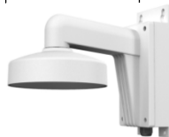
DS-1273ZJ-135B Настенный кронштейн с монтажной коробкой