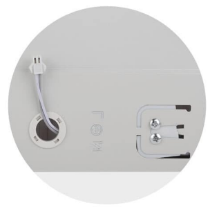
Коннектор для БАП