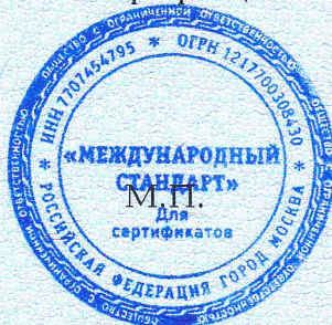
Схема сертификации: Зс.