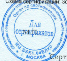
Схема сертификации: Зс.

Место нанесения знака соответствия: на изделии, на упаковке и технической документации.