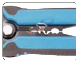
Опресовка неизолированного наконечника