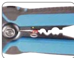
Опресовка изолированного наконечника