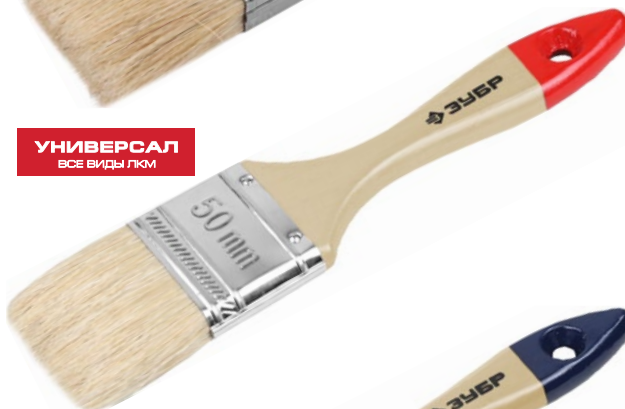
УНИВЕРСАЛ ВСЕ ВИДЫ ЛКМ