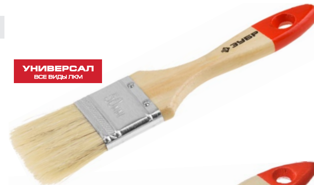
УНИВЕРСАЛ ВСЕ ВИДЫ ЛКМ