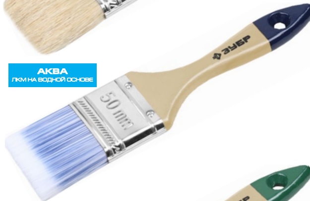
АКВА ЛКМ НА ВОДНОЙ ОСНОВЕ