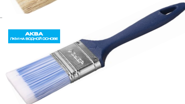
АКВА ЛКМ НА ВОДНОЙ ОСНОВЕ