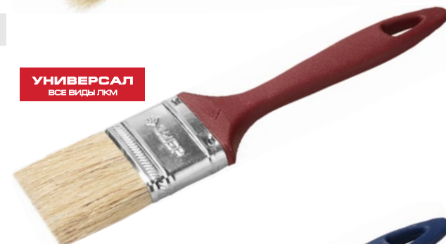
УНИВЕРСАЛ ВСЕ ВИДЫ ЛКМ