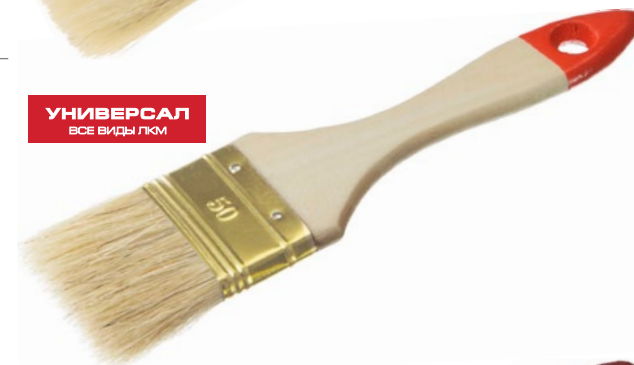
УНИВЕРСАЛ ВСЕ ВИДЫ ЛКМ