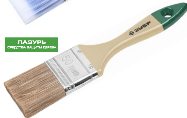
ЛАЗУРЬ СРЕДСТВА ЗАЩИТЫ ДЕРЕВА