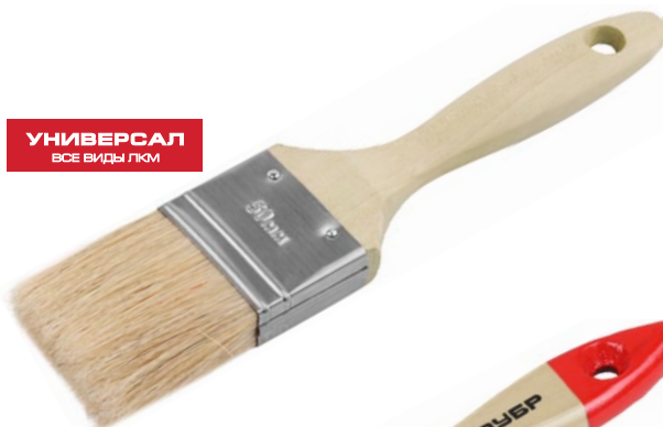
УНИВЕРСАЛ ВСЕ ВИДЫ ЛКМ