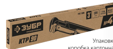
Упаковка: коробка картонная