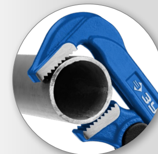
Наклонные под углом 90° губки