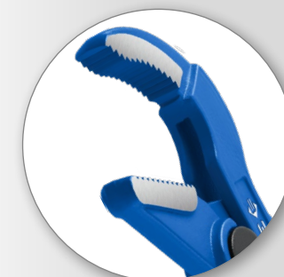
Цельнокованная конструкция: использование инструмента при высоких нагрузках