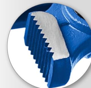
Угол наклона зубьев обеспечивает максимально возможное усилие захвата