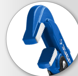
Цельнокованная конструкция: использование инструмента при высоких нагрузках