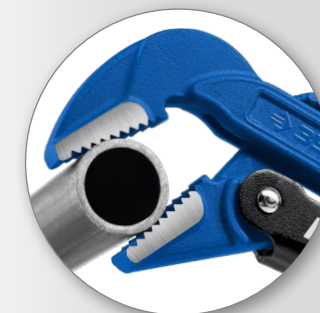
Наклонные под углом 45° губки для работы в труднодоступных местах