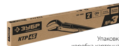
Упаковка: коробка картонная