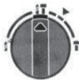
сверление с ударом